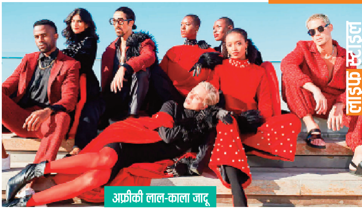
अफ्रीकी लाल-काला जादू

अफ्रीकन फैशन इंटरनेशनल (एएफआई) फैशन की दुनिया में गुणवत्ता, किफायती और प्रामाणिक अफ्रीकी डिजाइनर ड्रेस उपलब्ध कराता है। 2007 से शुरू हुई इस पहल ने वैश्विक फैशन उद्योग में विविधता की कमी को पूरा किया है। हाल ही में एएफआई में लाल और काले रंग के सम्मिश्रण के साथ मॉडल को पेश किया।