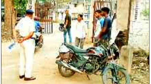
वाहन चेकिंग करती पुलिस।

बाद से अभियुक्त फरार चल रहे थे, पुलिस द्वारा मुखबीर लगाकर एवं अभियान चलाकर इन्हें पकड़ा और कोर्ट में पेश किया गया है। इनमें से कई शांति आरोपियों के संबंध में लुकछिप कर रहने की जानकारी मिली थी, कई शांति आरोपी जिले के अपराध में संलग्न होने से न्यायालय द्वारा वारंट जारी किये जाने पर पहचान छिपाकर सीमावर्ती राज्यों व जिलों में रहने लगे थे। पुलिस द्वारा पकड़े गये सभी वारंटियों को न्यायालय में पेश किया गया है।