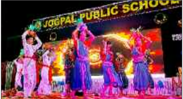
सांस्कृतिक कार्यक्रम प्रस्तुत करते बच्चे।