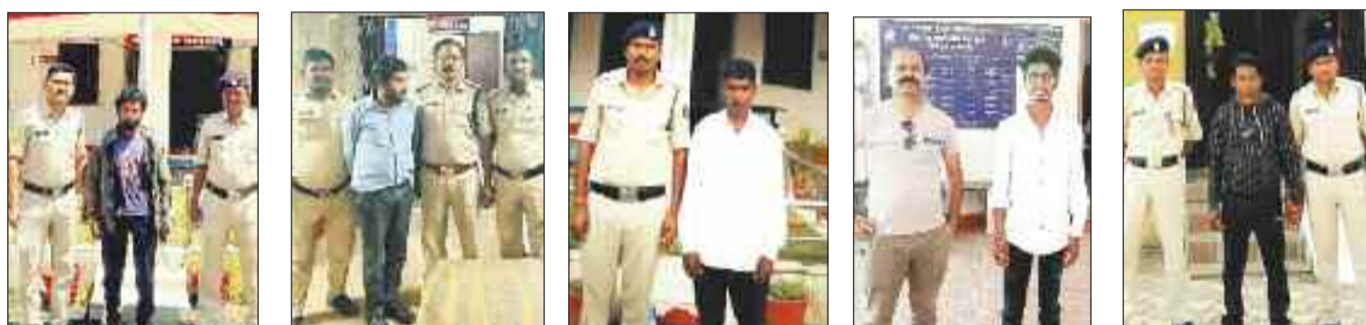
पुलिस गिरफ्त में आरोपी।