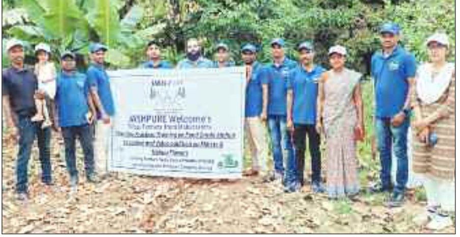
खेती के गुरु सीखे किसान।

महाराष्ट्र प्रान्त के पालघर जिले जावर विकासखंड से आये आदिवासी कृषक फार्मर्स प्रोड्यूसर कंपनी के किसानों ने जशपुर जिले में उगाये जा रहे सेव, नाशपाती, स्ट्राबेरी, मिर्च, टमाटर की खेती चाय की खेती का अध्ययन भ्रमण कर किसानों से चाय की खेती के गुरु सीखे। उसके बाद नाबाई बाड़ी कार्यक्रम के अंतर्गत ग्राम करदना में उगाये जा रहे सेव एवं नाशपाती बाड़ी का भ्रमण कर