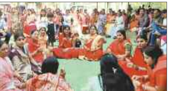
महर्षि कश्यप जयंती मनाते पहुंचे रौनियार समाज।

धाम पहुंचे सुबह 9:30 बजे से महर्षि कश्यप जयंती का विधिवत कार्यक्रम को शुरू किया गया जहां सर्वप्रथम महर्षि कश्यप की फोटो पे फूल माला पहना कर अगरवत्ती दिखा कर पूजन किया गया जहां महर्षि कश्यप की आरती गाई गई। तत्पश्चात शुक्रवार 5 अप्रैल महर्षि कश्यप जयंती की शुरुआत की गई सबसे पहले किलकिलेश्वर मंदिर में विराजमान भगवान भोलेनाथ को प्रणाम कर रौनियार समाज के आये सभी परिवार जनों को जलपान ग्रहण करने कहा तत्पश्चात सभी ने